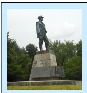
7. Socha horníka u příbramského gymnázia (sochař Ivan Lošák)