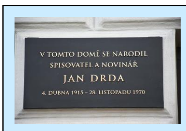
5. Dům na kterém je umístěna pamětní deska Janu Drdovi