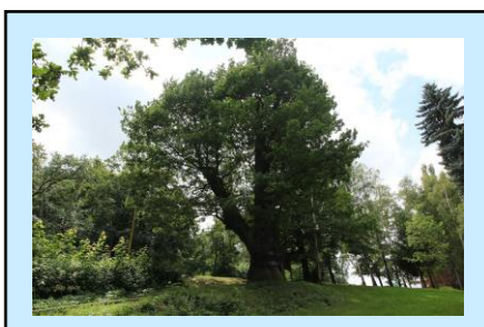
4. Svatohorský dub