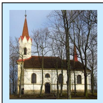
1. Kostel sv. Prokopa