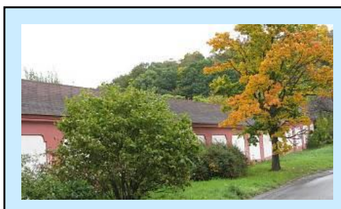
2. Svatohorské schody